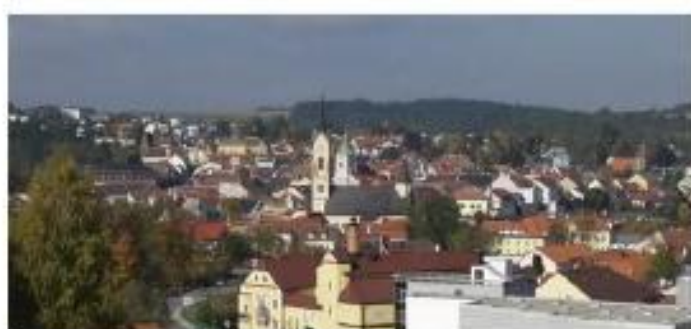
Zwettler Rätselfestung - schwierig

Scanne den QR-Code mit der Actionbound-App, um den Bound zu starten