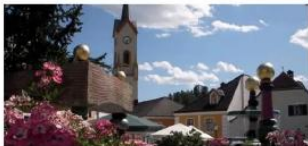
Zwettler Stadtbusgeschichten - Aus alter Zeit