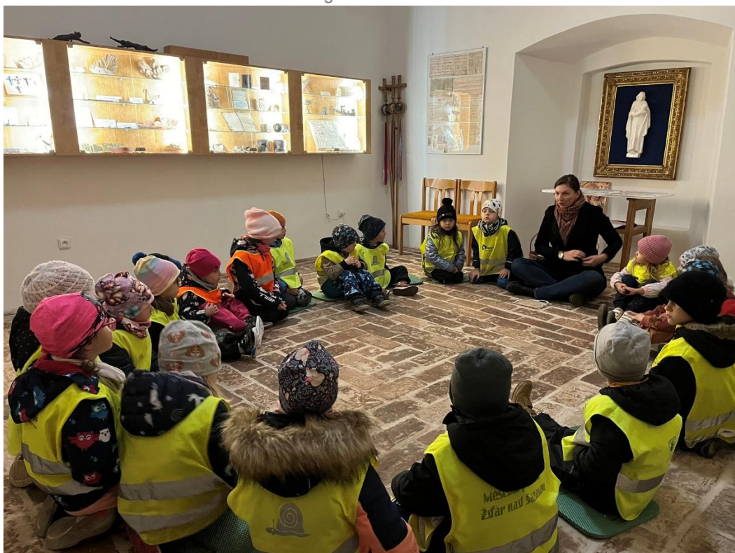
Abb.5: Vzdělávací činnost v sakrálních prostorách v Žďáru nad Sázavou Bildungsarbeit in sakralen Räumen von Žďár nad Sázavou

Die Vermittlung in sakralen Räumen ermöglicht es den Kindern, Geschichte „hautnah“ zu erleben – durch den Kontakt mit der Architektur und durch Geschichten, die in ihnen ein tieferes Interesse an der Geschichte der Stadt Žďár nad Sázavou und Europas wecken können. Gleichzeitig lehrt sie sie, die spirituelle Dimension des Lebens wahrzunehmen und die Werte zu achten, die Jahrhunderte überdauert haben.