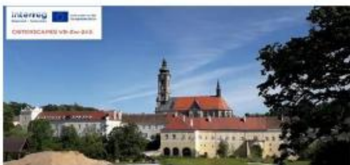
Stift Zwettl - Höfe und Gärten