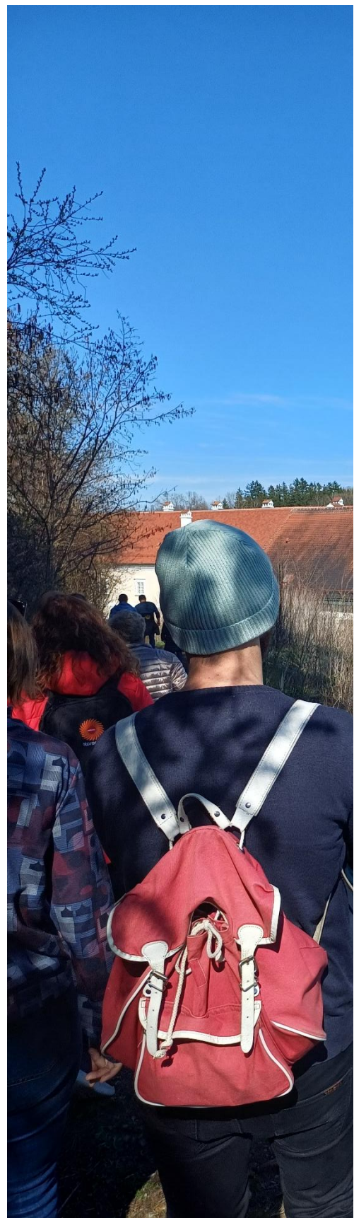
Abb.7: Klášter Zwettl Stift Zwettl

Akce v oblasti vzdělávání, které se konaly v posledních měsících, jasně ukázaly, jaký potenciál skýtá přeshraniční spolupráce. Spojením kompetencí a zdrojů vznikají nové perspektivy pro udržitelné vzdělávací a turistické projekty v tradičních klášterních krajinách střední Evropy.