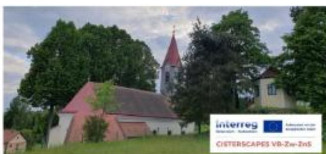
Historic Pilgrimage Path

Scanne den QR-Code mit der Actionbound-App, um den Bound zu starten