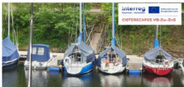
Teiche und See