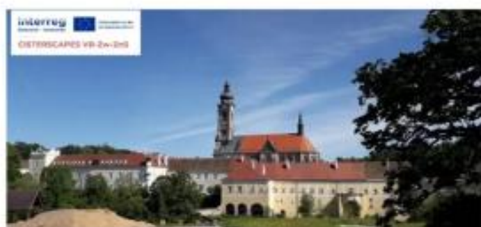
Monastery Zwettl - Courts and Gardens

Scanne den QR-Code mit der Actionbound-App, um den Bound zu starten