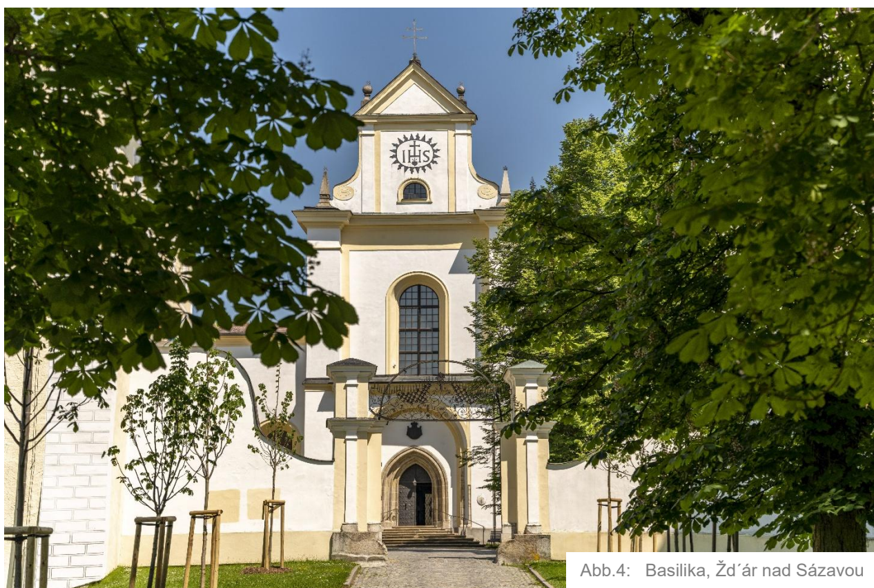
Abb.4: Basilika, Žďár nad Sázavou

Edukace v sakrálním prostoru umožňuje dětem zažít historii „na vlastní kůži“ - skrze kontakt s architekturou a skrze příběhy, které v nich mohou probudit hlubší zájem o dějiny města Žďáru nad Sázavou a Evropy. Zároveň je učí vnímat duchovní rozměr života a udržovat úctu k hodnotám, které přetrvaly staletí!