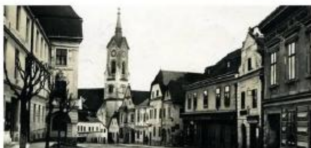
Zwettler Stadtbusgeschichten - Von Räubern und Gendarmen

Scanne den QR-Code mit der Actionbound-App, um den Bound zu starten