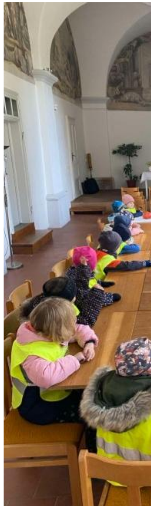
Abb.3: Vzdělávací činnost v sakrálních prostorách v Žďáru nad Sázavou Bildungsarbeit in sakralen Räumen von Žďár nad Sázavou

Edukace v sakrálním prostoru vyžaduje jasně nastavená pravidla: studenti a děti se učí respektovat posvátný charakter místa, což znamená především zklidnění, absenci běhání či hlasitého projevu. Tato „lekce pokory“ a ohleduplnosti je nedílnou součástí návštěvy a pomáhá žákům vnímat lépe daný prostor.