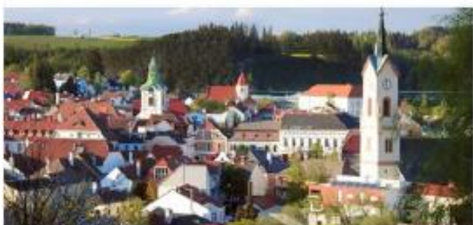
Zwettler Rätselfestung - einfach

Scanne den QR-Code mit der Actionbound-App, um den Bound zu starten