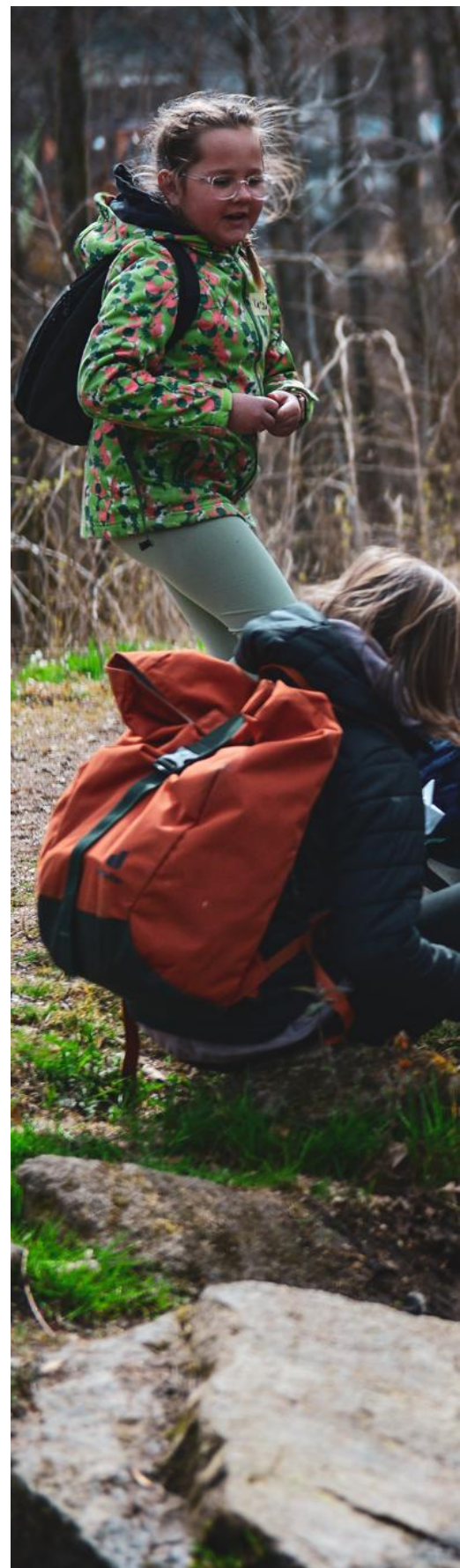
Abb.6: Zažijte kulturní krajinu ve Vyšším Brodu Kulturlandschaft erleben in Vyšší Brod

Po vysvěcení mostu opatem Johannesem Mariou Szypulskim a požehnání pro turisty se skupina více než 50 osob vydala na cestu. V rámci komentované túry „Mosty a mlýn“ měli účastníci možnost exkluzivně poznat některé zajímavé body (POI) klášterní krajiny ve Zwettlu, která v roce 2024 získala pečeť Evropského kulturního dědictví.