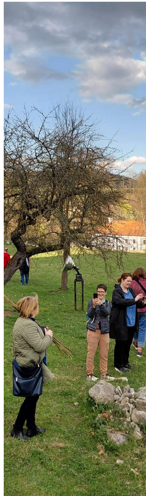
Abb.6: Klášter / Kloster Vyšší Brod

Nové stezky působivě ukazují, že dnešní krajina není dílem náhody. Naopak vznikla díky staleté práci lidí, kteří využívali přírodní zdroje a zároveň zacházeli se svým životním prostředím udržitelným způsobem.