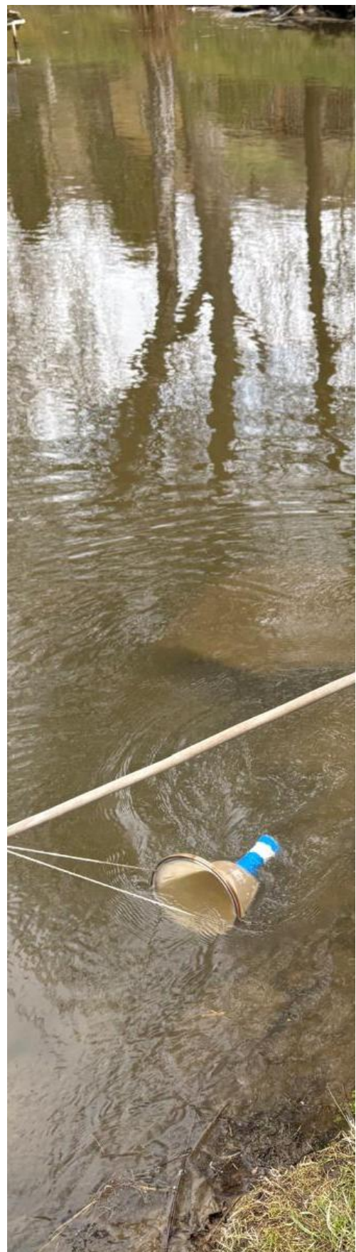
Abb.5: Rybníkářský workshop ve Vyšším Brodu Teichworkshop in Vyšší Brod

Odborníci z Rakouska, České republiky a Německa diskutovali o nových způsobech zprostředkování kulturního dědictví a představili inovativní koncepty v oblasti vzdělávání a cestovního ruchu. Teoretické přednášky byly doplněny workshopy, v nichž bylo možné vyzkoušet praktické příklady.