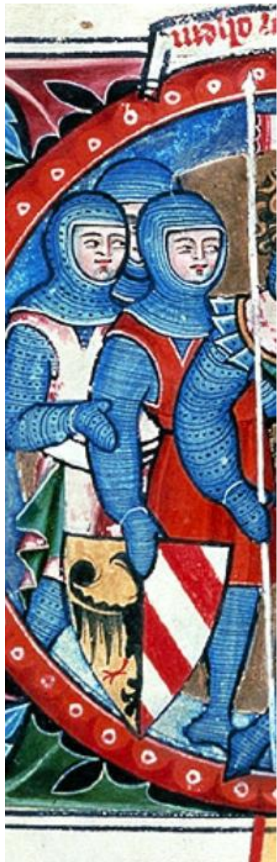
Abb.3: Detail z medvědí kůže, Zwettl Ausschnitt aus der Bärenhaut, Zwettl

Den zahájení nabízí pestrý program pro všechny generace. Prohlídky s průvodcem, interaktivní stanoviště, virtuální nahlédnutí do tradičního rybníkářství pomocí technologie VR i projížďky kaprovým kočárem umožňují prožít historii mnoha různými způsoby. Hudební vystoupení, kulinářské speciality a četná setkání vytvářejí slavnostní rámec pro tuto výjimečnou událost. Díky novému návštěvnickému centru získává klášterní krajina Zwettl ústřední výchozí bod pro budoucí objevitelské výpravy.