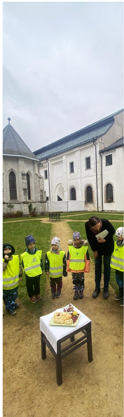
Abb.9: Vzdělávací program, Žďár nad Sázavou Bildungsprogramm, Žďár nad Sázavou