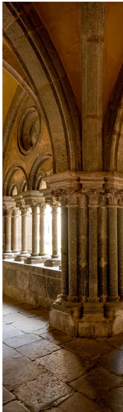
Abb.8: Klášter Zwettl Stift Zwettl

Zde se žáci učí nejen historická fakta. Zabývají se také otázkami komunity, odpovědnosti, udržitelnosti a kulturní identity.