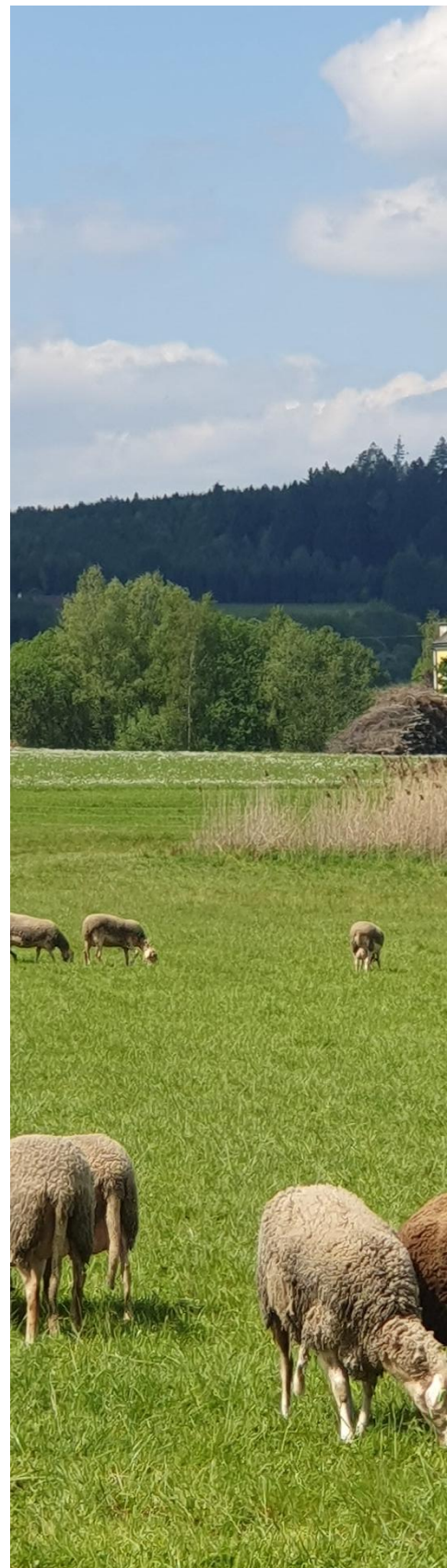
Abb.2: Ovce na bývalém Grangie Ratschenhof, Zwettl Schafe bei der ehemaligen Grangie Ratschenhof, Zwettl

Právě toto propojení přírody, kultury a hospodářského rozvoje činí z krajiny Cisterscapes atraktivní turistické cíle jak pro milovníky kultury, tak pro turisty, rodiny i milovníky přírody.