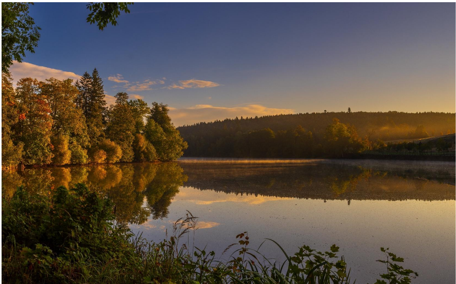
Abb.4: Zelená Hora / Grüner Berg, Žďár nad Sázavou

Četné rozhovory s aktéry v oblasti cestovního ruchu, obcemi, vzdělávacími institucemi a regionálními partnery ukázaly, jak velký je zájem o společný rozvoj klášteřních krajín.